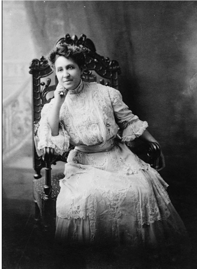
圖2 Mary Church Terrell

資料來源：“Mary Church Terrell, three-quarter length portrait, seated, facing front.” Black & white photoprint, available from Library of Congress, Prints and Photographs Division. http://www.loc.gov/pictures/item/97500102/ (2023/8/14).